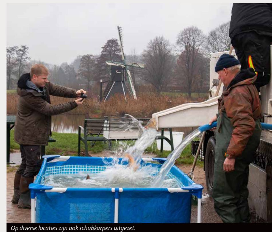
Op diverse locaties zijn ook schubkarpers uitgezet.