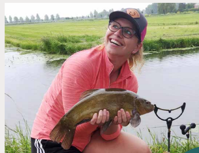
Het begon allemaal met feedervissen met haar vriend en schoonvader.