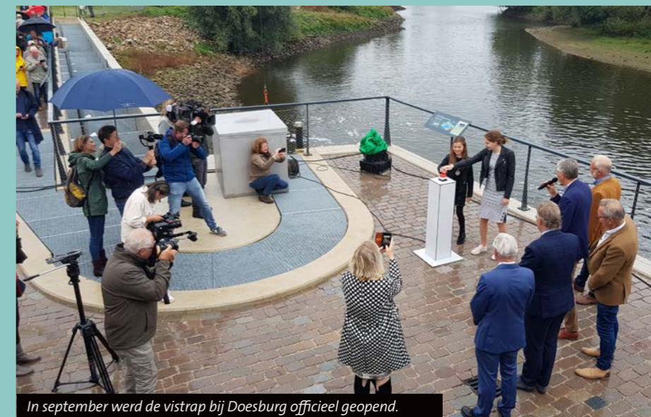
In september werd de vistrap bij Doesburg officieel geopend.

V oor de Oude IJssel was deze vispassage de laatste hobbel die nog moest worden genomen; alle andere stuwen in de Oude IJssel waren al vispasseerbaar gemaakt. Vissen kunnen nu vanaf de IJssel richting Duitsland zwemmen om daar te paaien. In Duitsland gaat de Oude IJssel en Aa-Strang over in een kleinere beek met snelstromend water. Hier liggen perfecte paaimogelijkheden voor migrerende vissoorten als de winde, die over grote afstanden migreren. Daarnaast zal de Oude IJssel onder meer