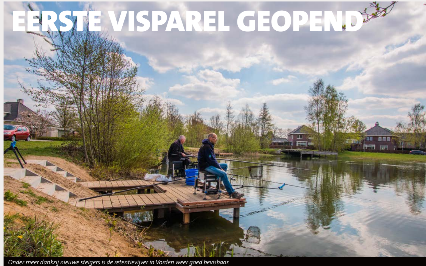
Onder meer dankzij nieuwe steigers is de retentievijver in Vorden weer goed bevisbaar.